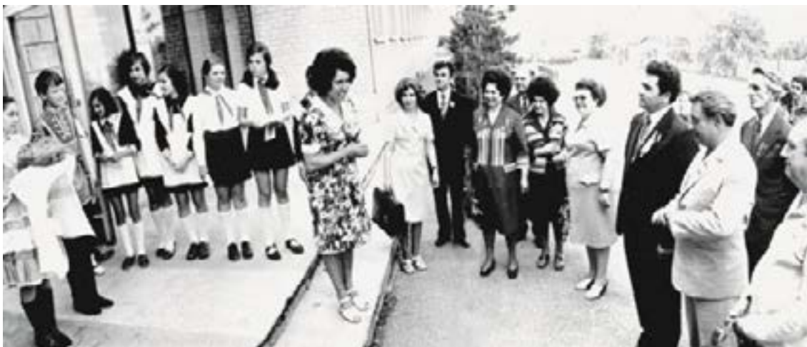
Болгарские друзья в гостях у азовских пионеров. 1974 год

При строительстве городского Дворца культуры и парка возникла необходимость перенести останки со старого кладбища. Молодёжь города выполнила и это задание.