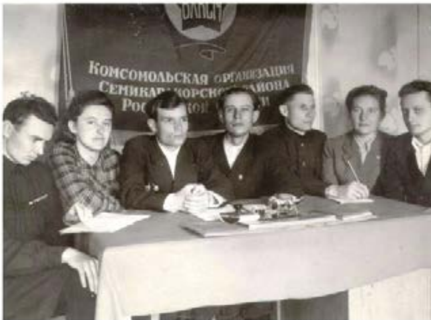
Члены бюро Семикаракорского РК ВЛКСМ.