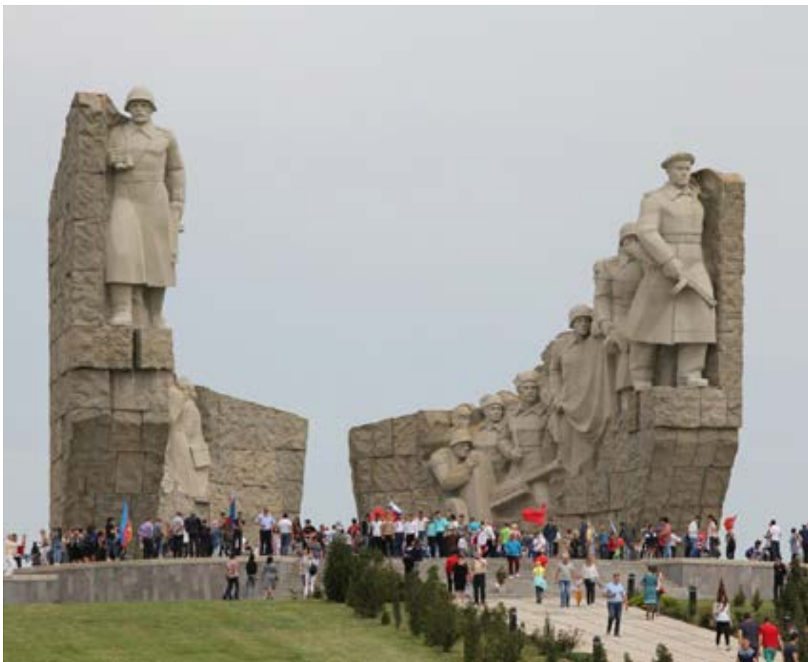
Мемориальный комплекс «Самбекские высоты»