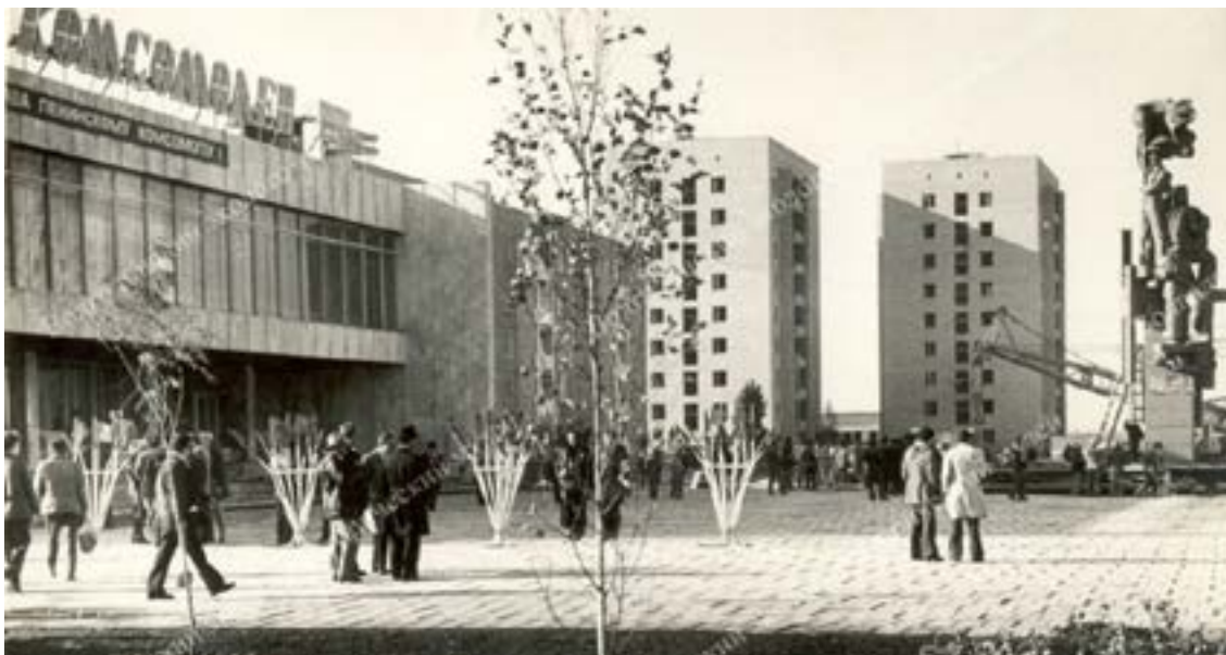
Благоустройство территории возле кинотеатра «Комсомолец»