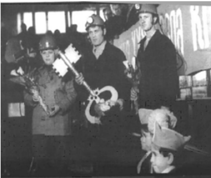
Открытие шахты, 1978 год