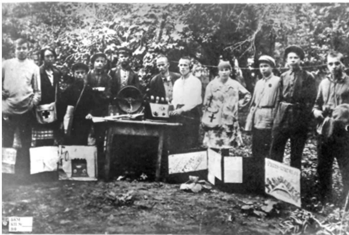
Комсомольский агитотряд, 30-е годы