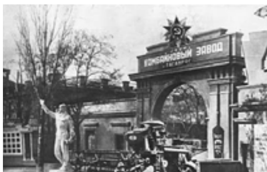
Комбайновый завод, г. Таганрог

Вследствие реконструкции «Ростсельмаш» становится специализированным предприятием, готовым обеспечить сельское хозяйство страны современной для того времени техникой. В 1984 году выпущен двухмиллионный комбайн.