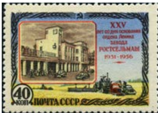
Почтовая марка СССР