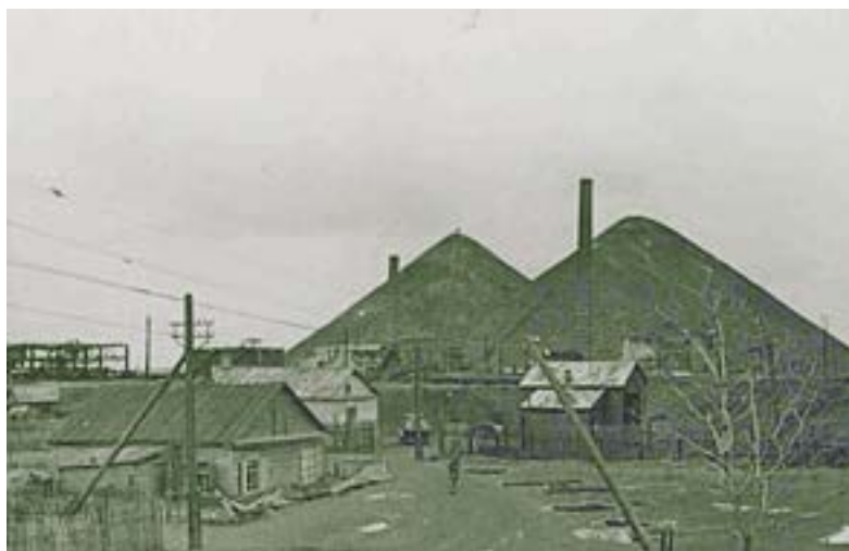
Шахта «Октябрьская революция»