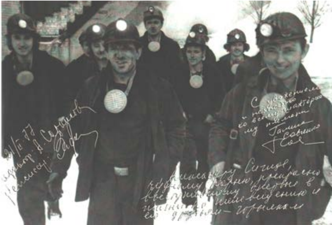
Шахтёрская бригада, 1977 год

подготовили трёх кандидатов в мастера спорта СССР, 39 спортсменов первого разряда, свыше 3,5 тысяч спортсменов массовых разрядов и около 4 тысяч значкистов БГТО, ГТО и ГЗР. Городской комитет по физкультуре и спорту с горкомом комсомола к 100-летию со дня рождения В. И. Ленина провёл спартакиаду по десяти видам спорта, в которой участвовало свыше 10 тысяч человек.