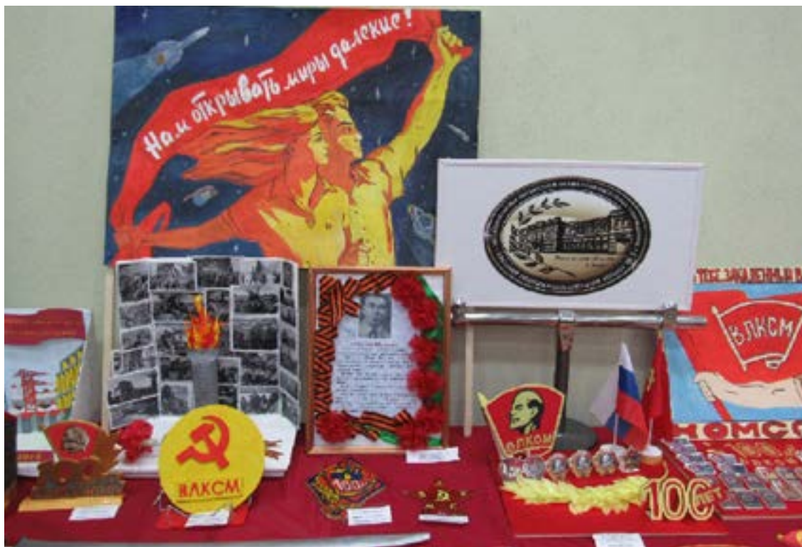
Дворец культуры г. Азова, выставка посвященная 100-летию ВЛКСМ

1945–1950 гг. Эти послевоенные годы отмечены в истории Азовского комсомола как ударные. Молодёжь участвовала в восстановлении народного хозяйства.