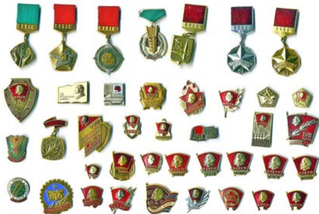
Комсомольский билет, памятка, комсомольский значок, знаки отличия — атрибутика ВЛКСМ.