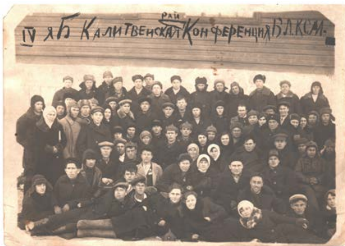
IV-я Белокалитвенская районная конференция ВЛКСМ