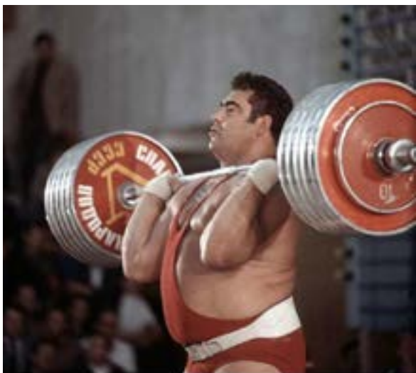
Алексеев Василий Иванович

Алексеев Василий Иванович. Установил 80 мировых рекордов, чемпион XX Олимпийских игр в супертяжёлом весе (Мюнхен, 1972 г.), чемпион XXI Олимпийских игр (Монреаль, 1976 г.), участник XXII Олимпийских игр в Москве (1980 г.), чемпион мира (1970–1977 гг.), Европы (1970–1978 гг.), СССР (1970–1976 гг.). Награждён многочисленными орденами, почётный гражданин города, являлся главным тренером сборной страны. В 1999 году в Греции признан лучшим спортсменом XX века, а в 2000 году — легендой российского спорта XX века.