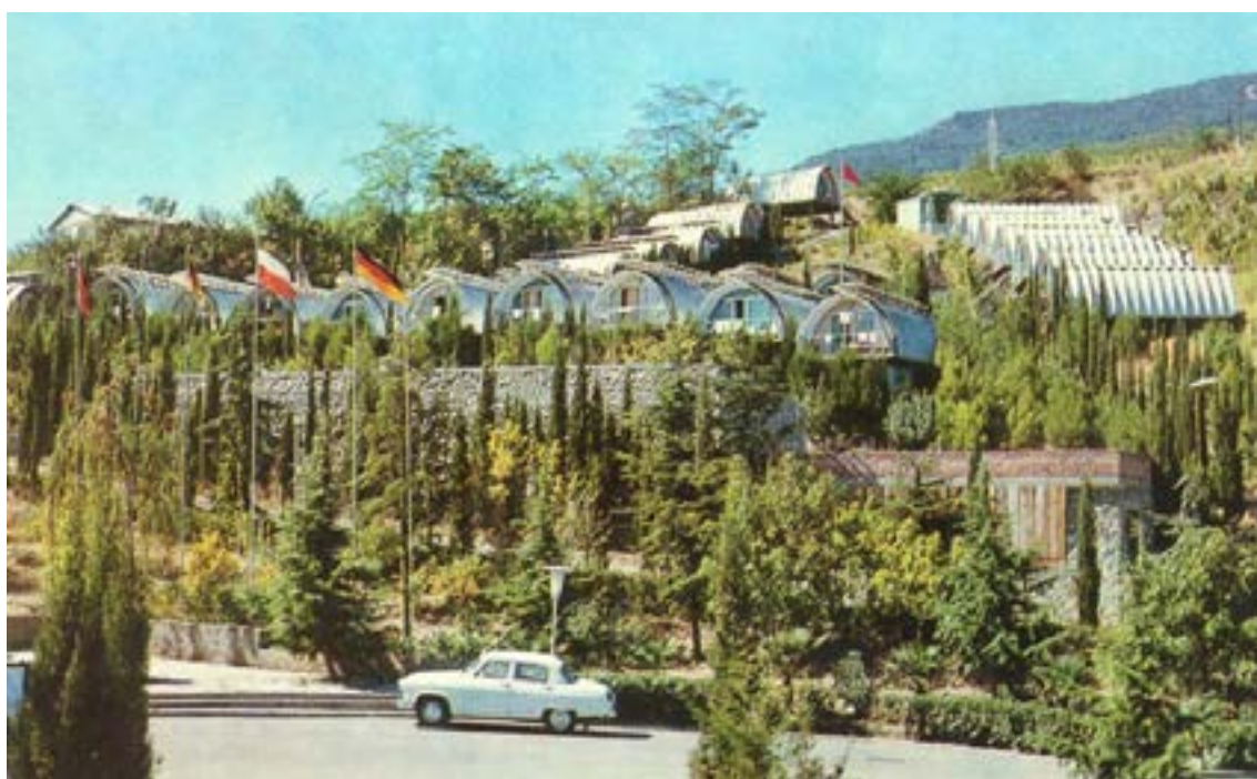
Крым. Гурзуф. Международный молодежный лагерь «Спутник»

Организация безвалютного обмена группами учащейся молодёжи с партнёрами БММТ «Спутник» в Польской Народной Республике и городах-побратимах Ростова-на-Дону: приём и обслуживание групп иностранных студентов и школьников на территории Ростовской области с размещением в семьях для преодоления языкового барьера, расширения межнационального общения и культурного обмена,