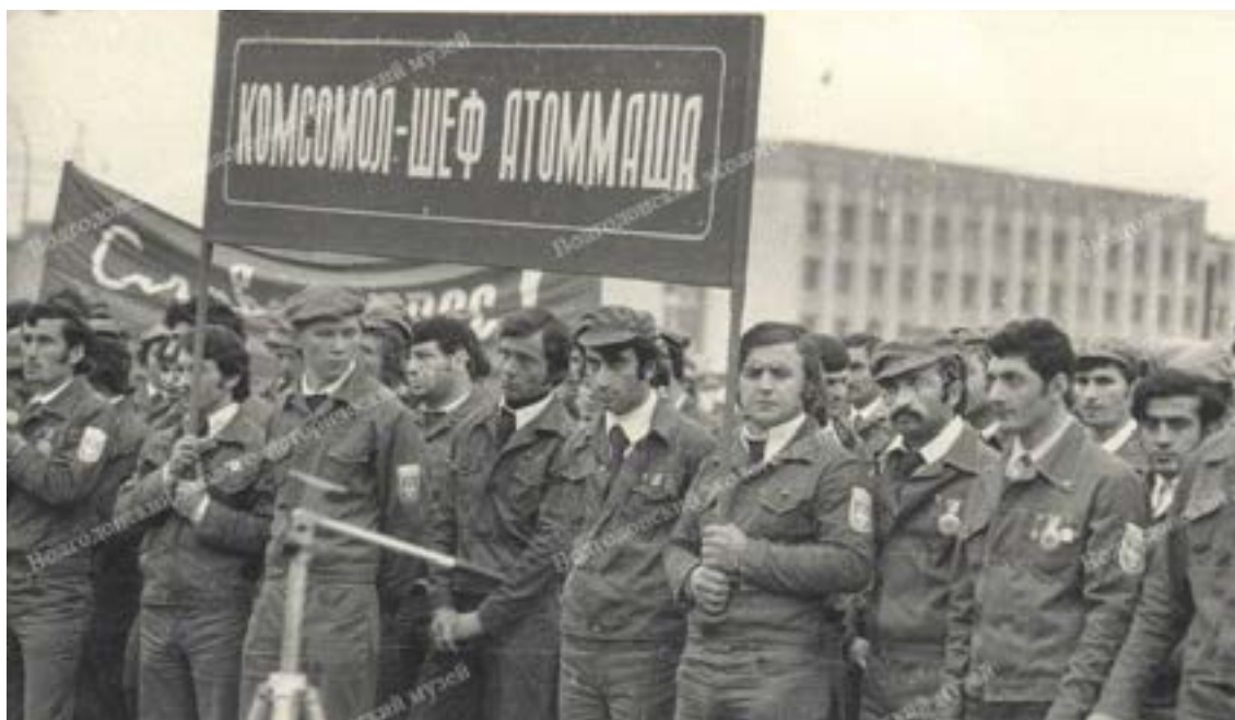
Комсомольские строительные отряды

Был создан штаб комсомольской ударной стройки комбината, который решал вопросы по расселению прибывающих на стройку людей, помощи в определении